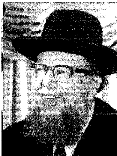
5. זריעה ובנין בחינוך (הרב שלמה וולבה זצ"ל)